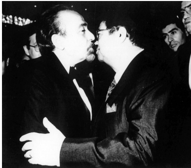
Hürriyet'in patronu Erol Simavi ve Başbakan Turgut Özal

Başbakan-medya patronu gerilimi, her dönem yaşanan bir sorun. Yeni olansa, bu kavganın içine ticaretin ve medya patronlarının siyaseti dizayn etme çabalarının da girmiş olması. İktidar veya siyasilerle basın arasındaki sert polemiklerin başlangıcı, koalisyonlar dönemine uzanıyor. 1991-2002 yılları arasında 11 yıl devam eden koalisyonlar dönemi, aynı zamanda güçsüz hükümetlerin ve muktedir olamayan siyasetçilerin sahne aldıkları yıllar. Gittikçe zayıflayan siyaset kurumunun ürettiği bölük-pörçük iktidarların, gittikçe güçlenen medya tarafından şekillendirilmek istenmesi, bu dönemin en karakteristik yönünü oluşturuyor. Koalisyonlar döneminin medya-siyaset ilişkileri açısından en akılda kalan fotoğrafı, Aydın Doğan'ın kendisini ziyarete gelen Başbakan Mesut Yılmaz'ı yalısının kapısında karşılaması oldu. Aydın Bey yalanlansa da 'pijamayla başbakan karşılama', literatüre girdi ve siyaset-medya ilişkisinde örnek vaka olarak kayıtlara geçti.