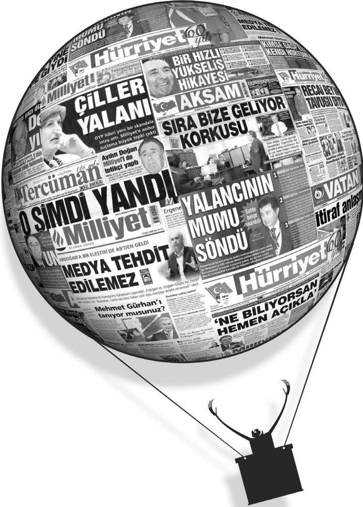
Grafik: Süleyman Karaoğlu