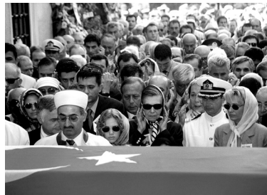
Orgeneral Güven Erkaya'nın cenaze merasimi